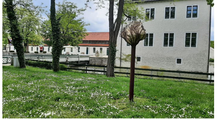
Schloss Benkhausen