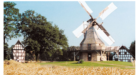
Mühle Lavern