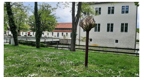
Schloss Benkhausen