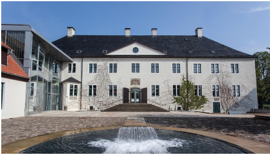
Schloss Benkhausen