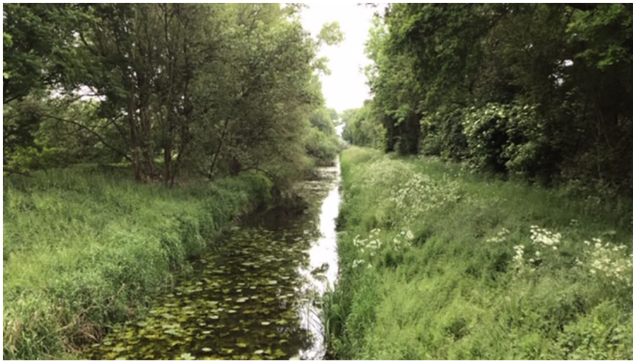
Große Aue