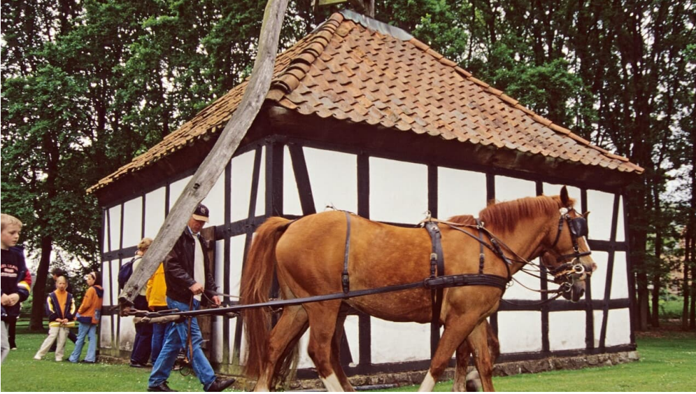
Rossmühle Rahden