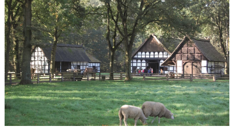
Museumshof Rahden