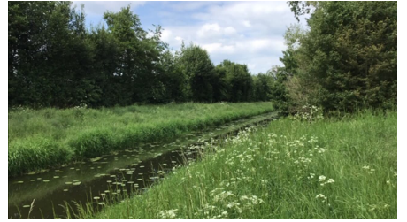
Große Aue