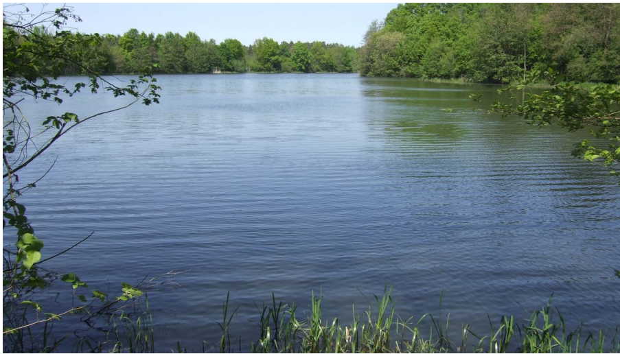
See am Kleihügel