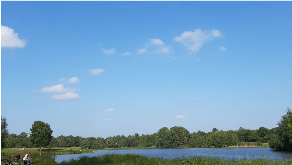
See am Kleihügel