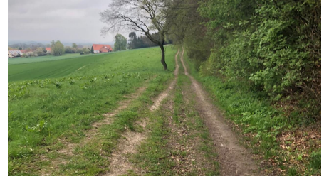
Bergkirchen - Schwöen (4).jpg