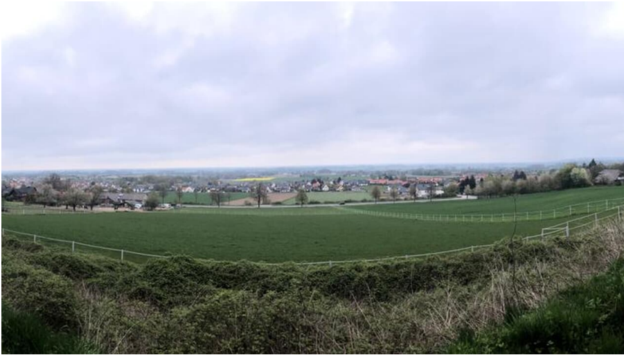
Bergkirchen - Schwöen (5).jpg