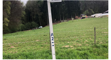
Bergkirchen - Schwöen (2).jpg