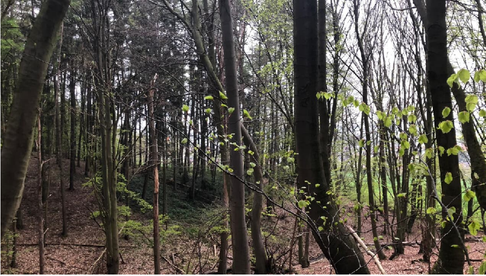
Bergkirchen - Schwöen (3).jpg