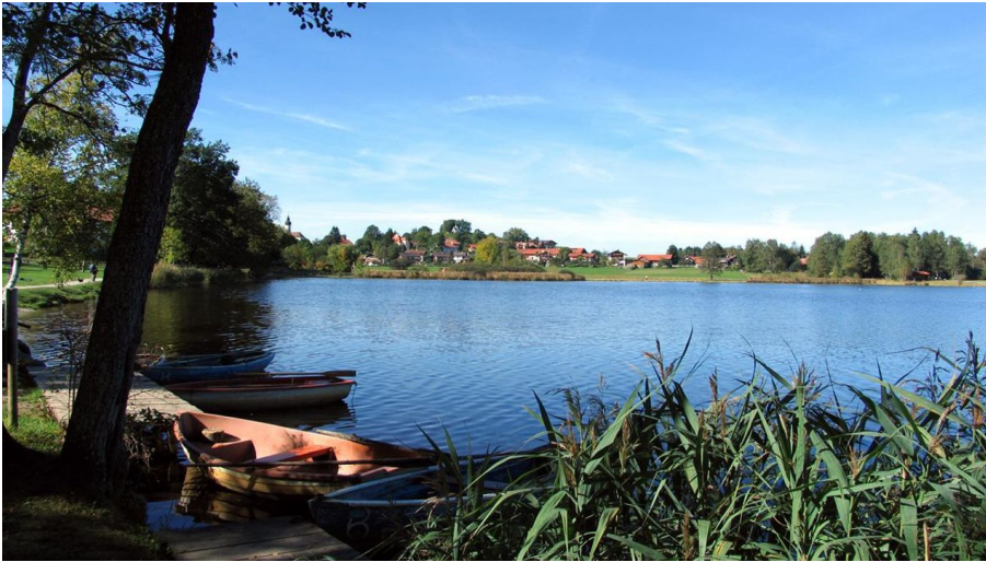
Wanderung - Große Seeumrundung