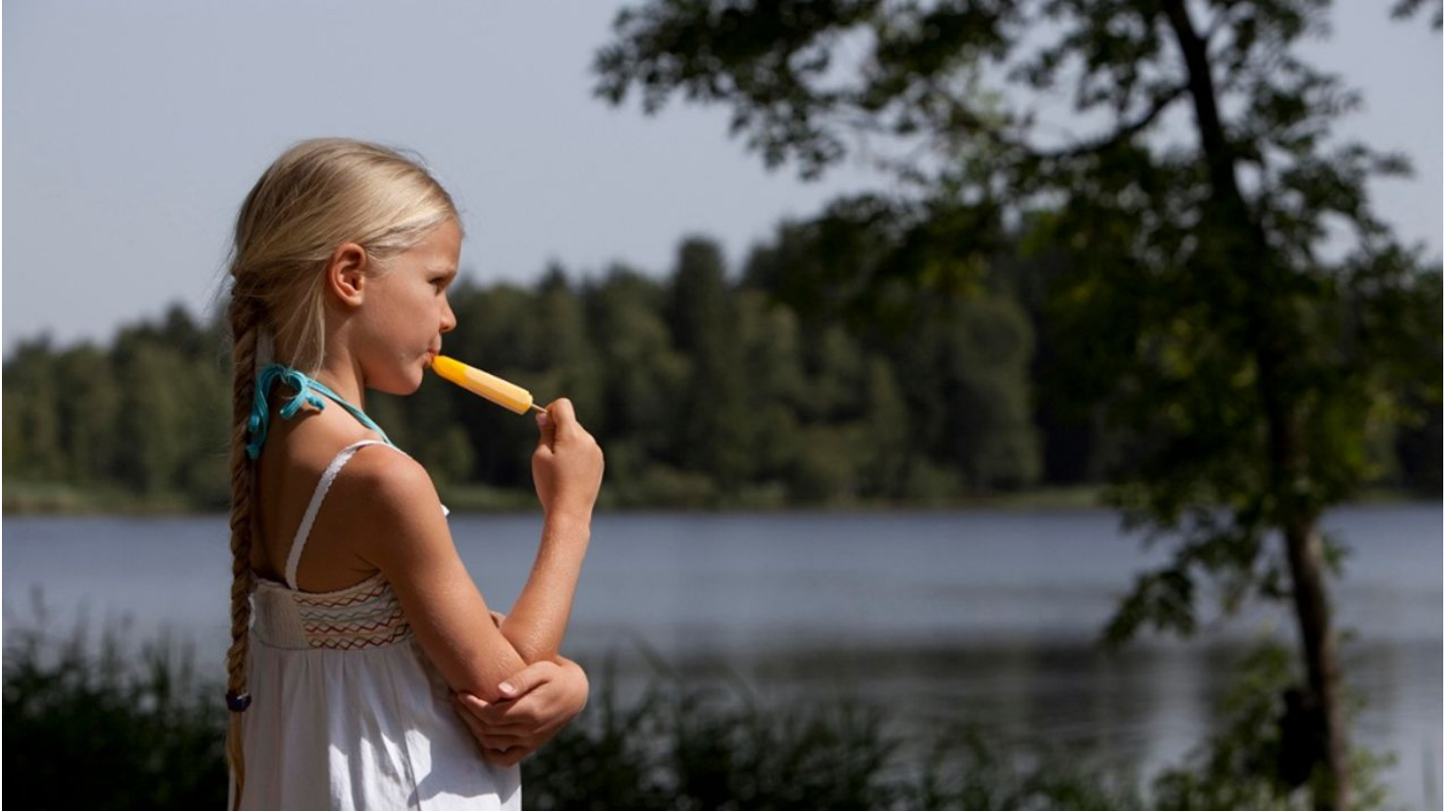
Wanderung - Große Seemrundung - © Thorsten Unseld, Florian Wagner