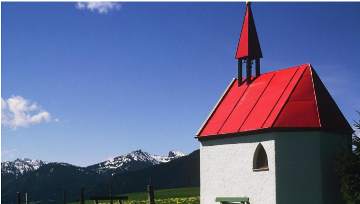
Wanderung - Zum Ammerdurchbruch - © Thorsten Unsel, Alois Schindler