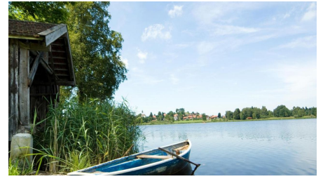
Wanderung - Zum Ammerdurchbruch - © Thorsten Unsel, Daniela Blöching