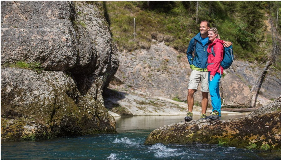
Naturpark Ammergauer Alpen