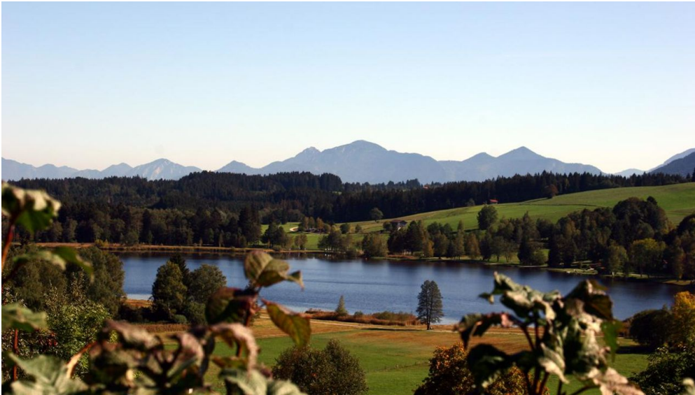
Wanderung - Zum Ammerdurchbruch