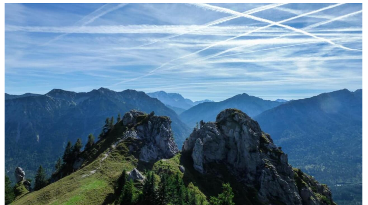
Bergtour - Gratüberschreitung im königlichen Jagdrevier