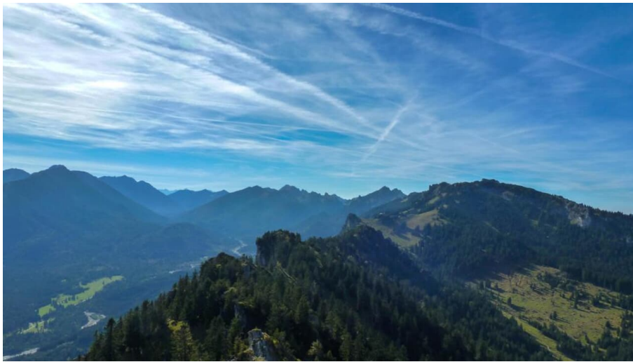
Bergtour - Gratüberschreitung im königlichen Jagdrevier - Blick ins hintere Graswangtal