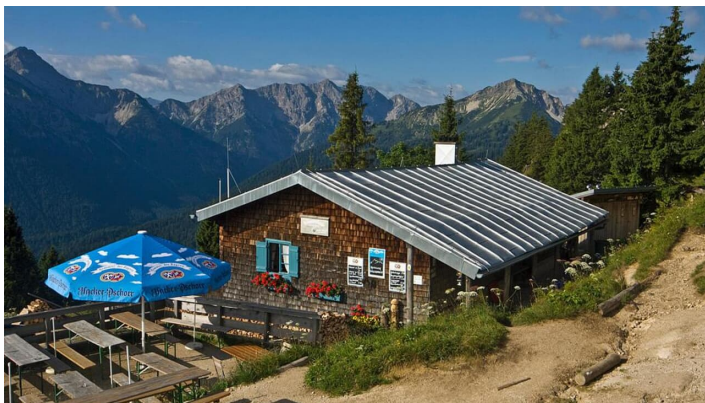
Bergtour - Gratüberschreitung im königlichen Jagdrevier - Brunnenkopfhäuser - © Thorsten Unseld, Norbert Misniks