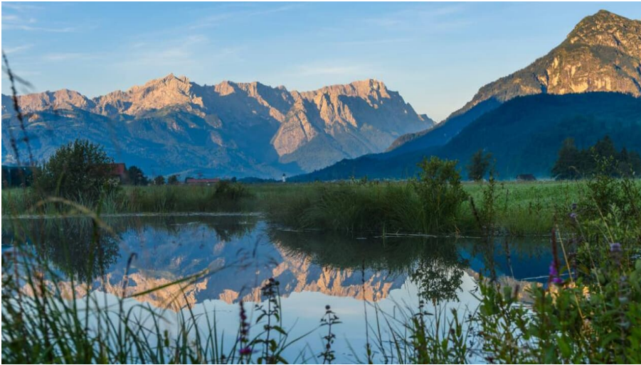
Blick vom Loisachtal auf Wettersteinmassiv und Kramer