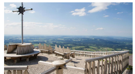
Hüttenwanderung - Seen, Moore und Berge