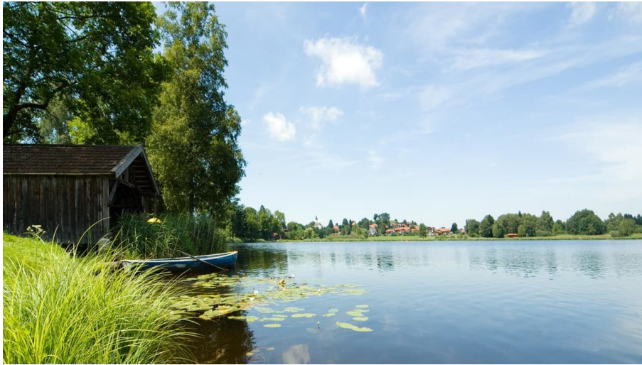
Soier See - Hüttenwanderung - Seen, Moore und Berge - © Thorsten Unsel, Daniela Blöching