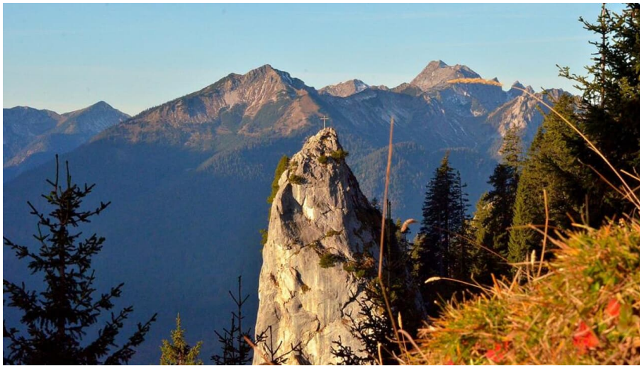
Hüttenwanderung - Seen, Moore und Berge