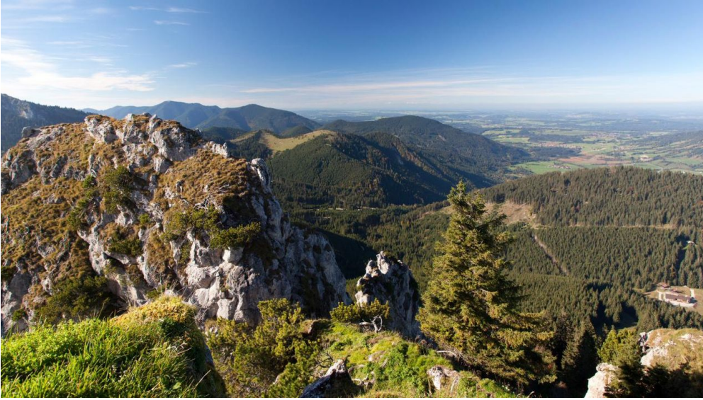
Panoramablick - Hüttenwanderung - Seen, Moore und Berge