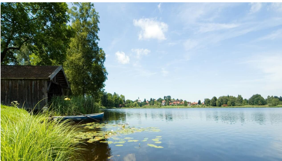
Soier See - Hüttenwanderung - Seen, Moore und Berge

Prospektmaterial ansehen und/oder bestellen