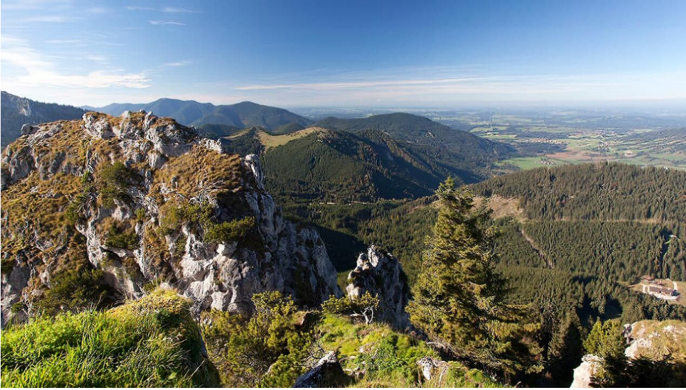
Panoramablick - Hüttenwanderung - Seen, Moore und Berge