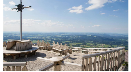
Hüttenwanderung - Seen, Moore und Berge