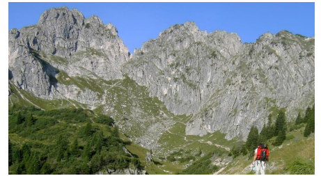
Hüttenwanderung - Seen, Moore und Berge