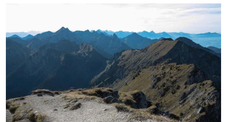
Gipfel-Grosse-Klammspitze (1) - © Thorsten Unselde, Sebastian Scheibel