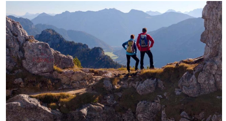
Hüttenwanderung - Hüttenwoche Ammergauer Alpen (4. Etappe von 6)