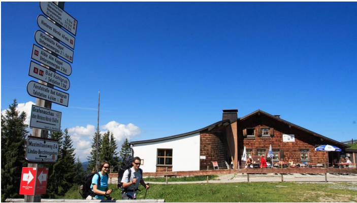
Hüttenwanderung - Seen, Moore und Berge (1.Etappe von 3)

Prospektmaterial ansehen und/oder bestellen