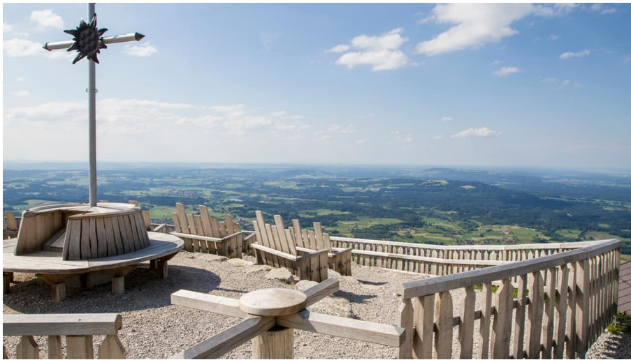
Hüttenwanderung - Seen, Moore und Berge (1. Etappe von 3)