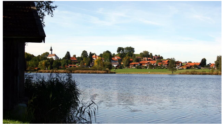
Hüttenwanderung - Seen, Moore und Berge (1.Etappe von 3) - © Thorsten Unseld, Hanspeter Schöne