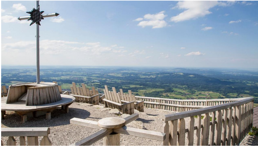
Hüttenwanderung - Seen, Moore und Berge (1.Etappe von 3)