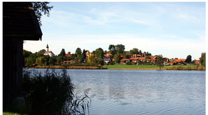
Hüttenwanderung - Seen, Moore und Berge (1.Etappe von 3)