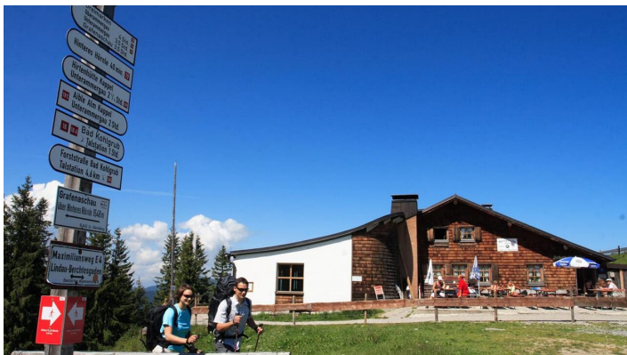
Hüttenwanderung - Seen, Moore und Berge (1.Etappe von 3)

Prospektmaterial ansehen und/oder bestellen