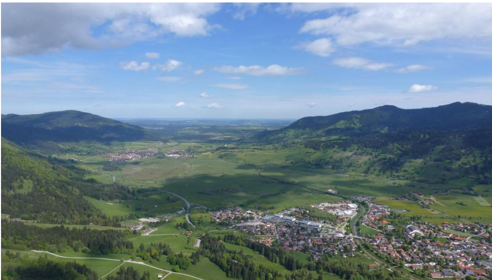
Ammergauer Höhenweg (1.Etappe von 4)

Prospektmaterial ansehen und/oder bestellen