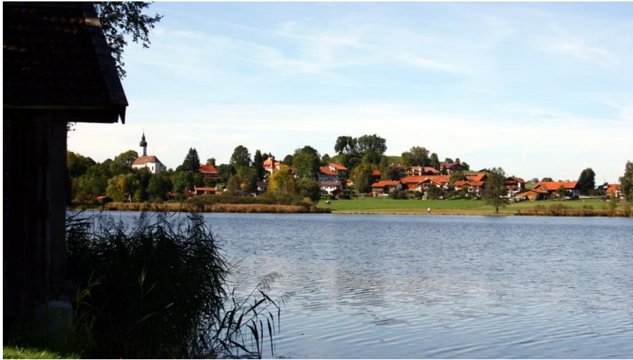
Hüttenwanderung - Hüttenwoche Ammergauer Alpen (1. Etappe von 6)