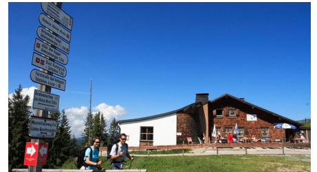
Hüttenwanderung - Hüttenwoche Ammergauer Alpen (1.Etappe von 6)