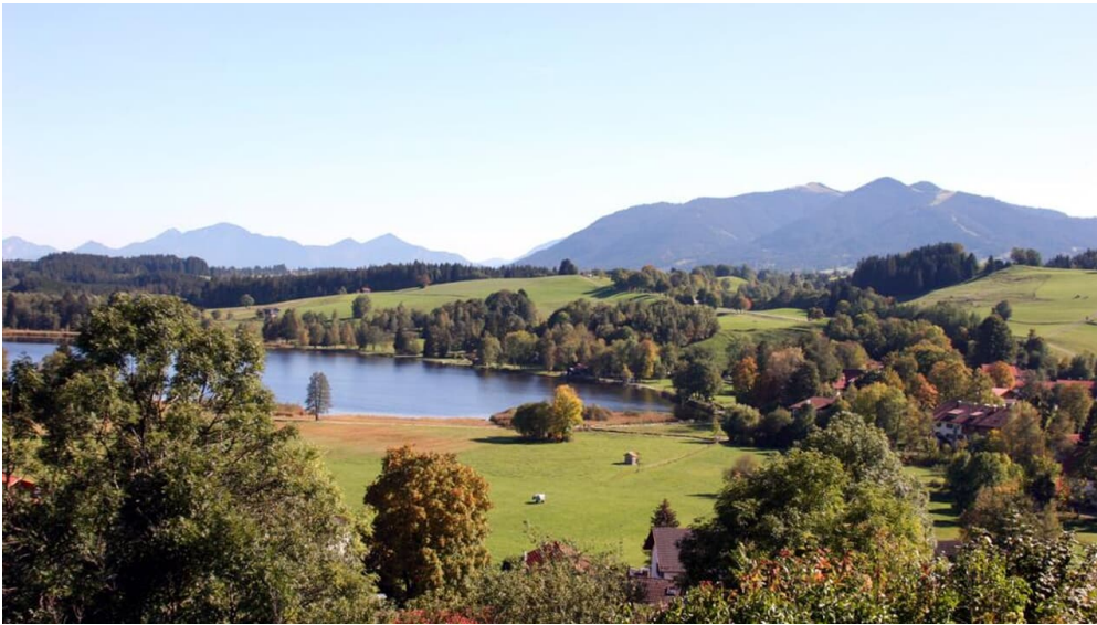
Hüttenwanderung - Hüttenwoche Ammergauer Alpen (1.Etappe von 6)

Prospektmaterial ansehen und/oder bestellen