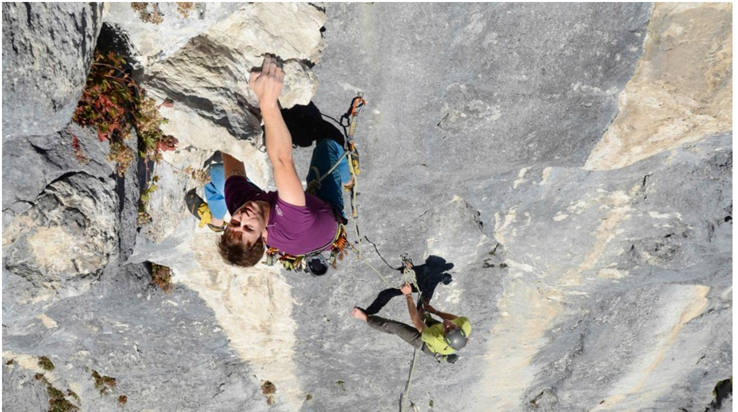
Klettergebiet - Frauenwasserl