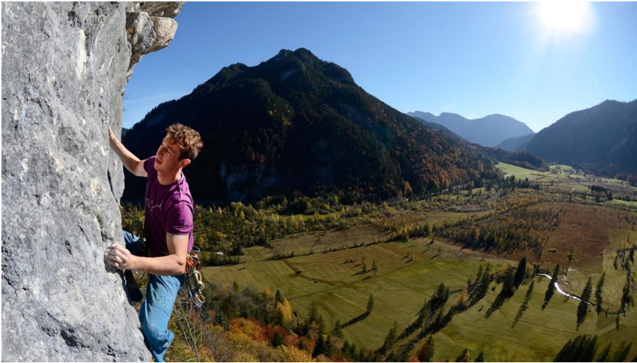
Klettergebiet - Frauenwasserl