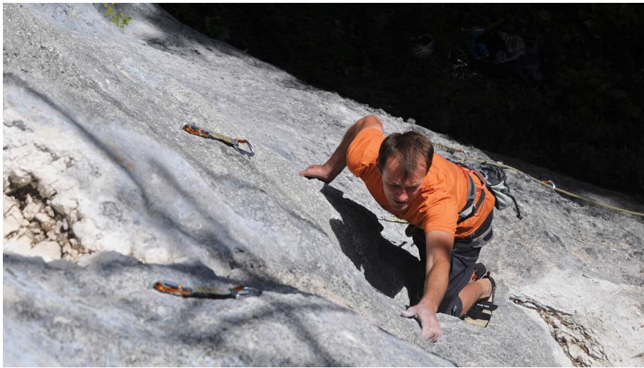
Klettergebiet - Kraxntrager