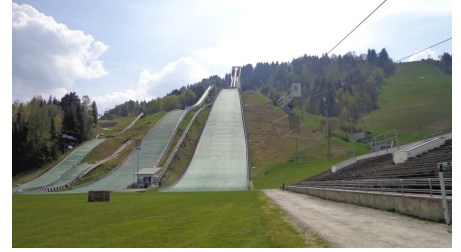
Olympiastadion - © Bettina Plank, GaPa Tourismus