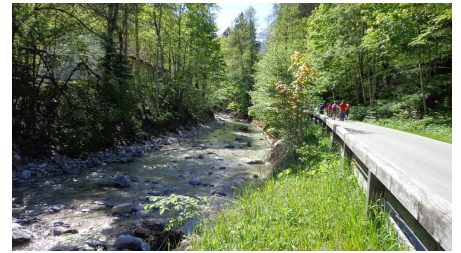
Uferweg zwischen Olympiastadion und Partnachklamm