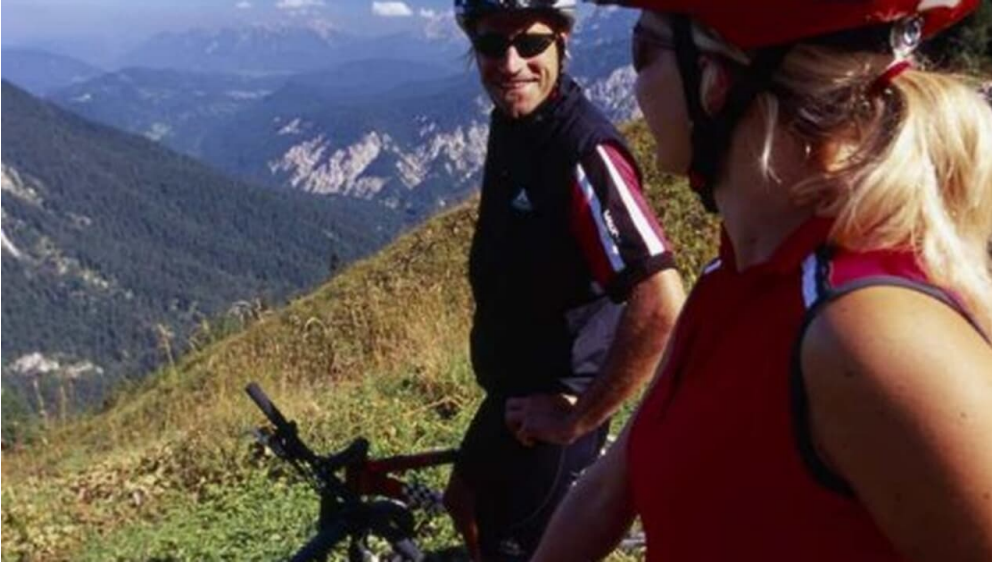
GaPa Tourismus GmbH