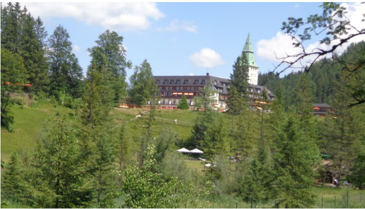
Schloss Elmau