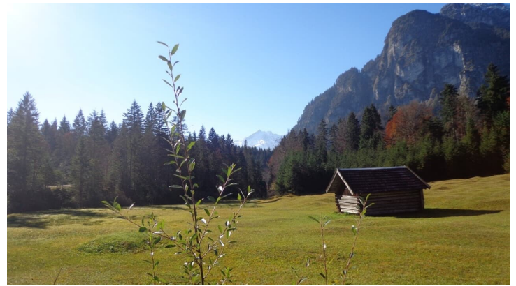
Blick auf den Königstand