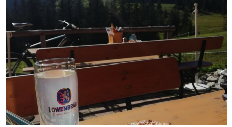
Enning Alm