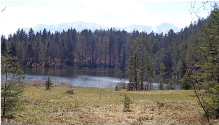
Schmölzersee - © Bettina Plank, GaPa Tourismus