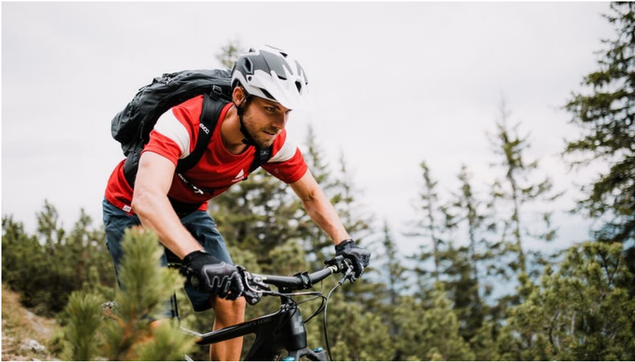
Mountainbiketour in der Zugspitz Arena Bayern-Tirol