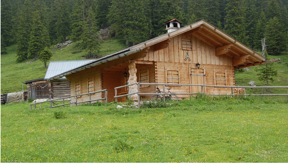
Die Enning Almhütte. - © Outdooractive Redaktion