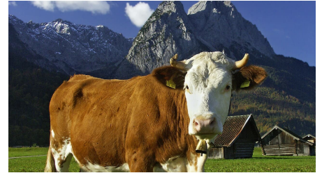
GaPa Tourimus Online, GaPa Tourismus GmbH