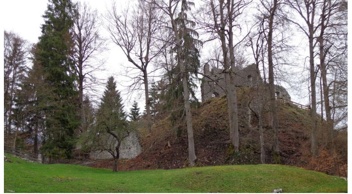
Burgruine Werdenfels