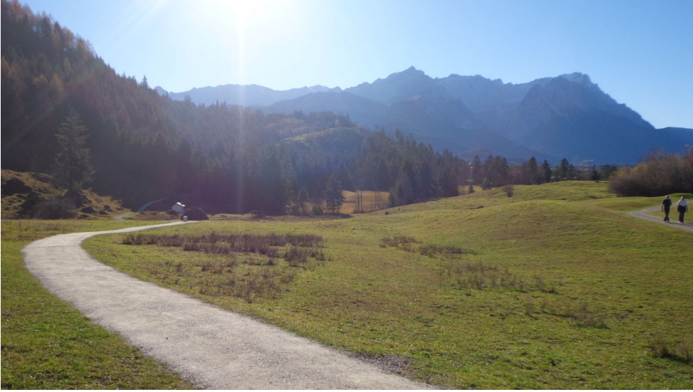
Zugspitz - Alpspitz Panorama