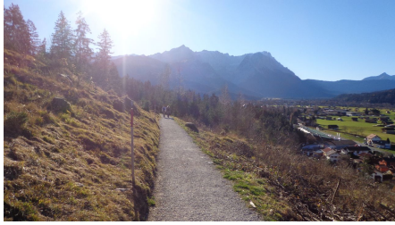
Teilstück oberhalb von Partenkirchen