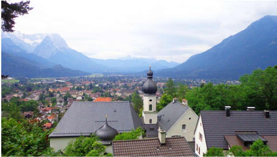
St. Anton