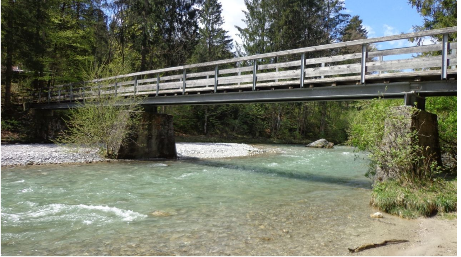
Am Hergottsschrofen