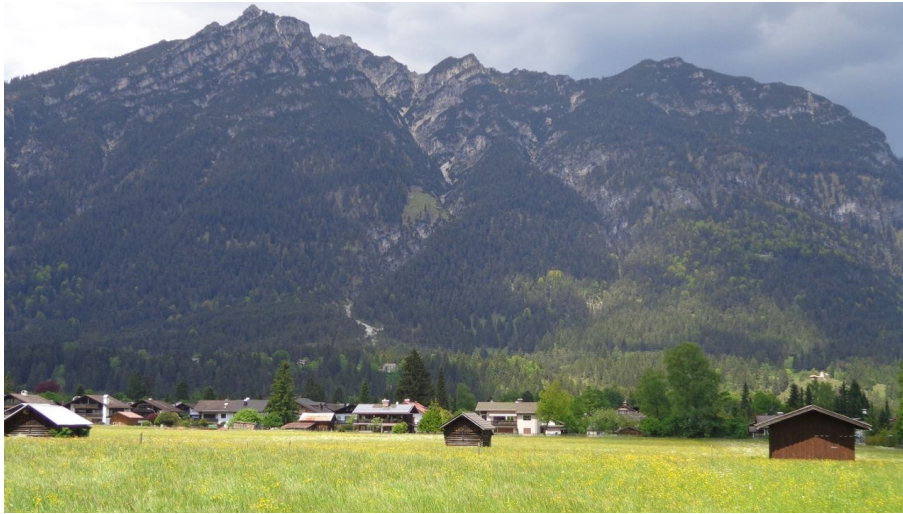
Blick auf den Kramer