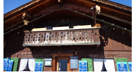
St. Martin Hütte