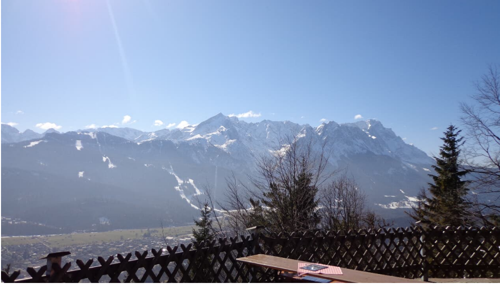
Blick von St. Martin