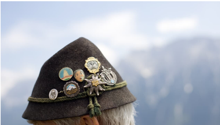
Wanderhut mit Wandernadeln