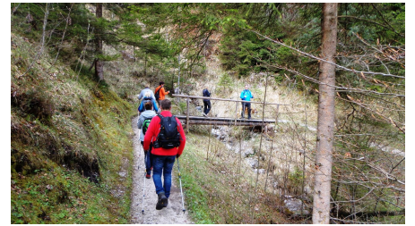
Aufstieg zu St. Martin