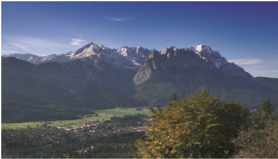
GaPa Tourismus Online, GaPa Tourismus GmbH