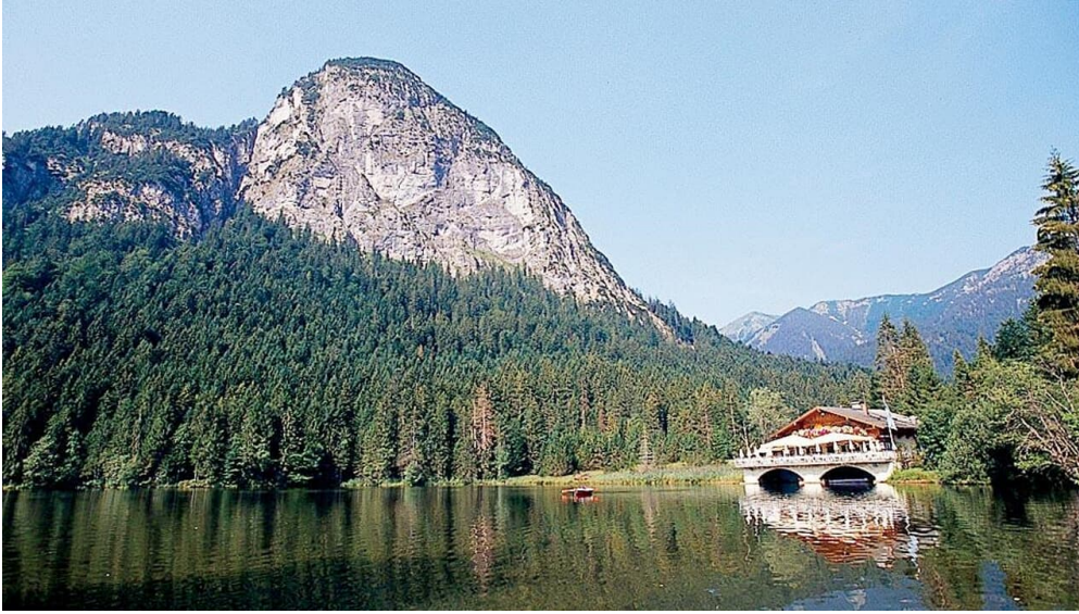
GaPa Tourismus GmbH