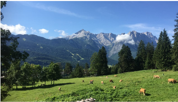
Blick vom Kramerplateauweg