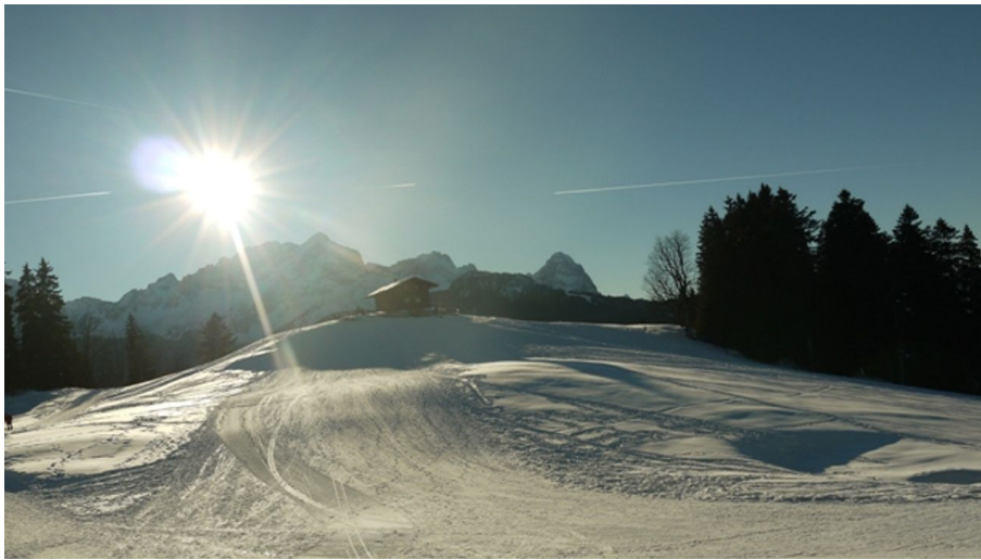
GaPa Tourismus Online, GaPa Tourismus GmbH