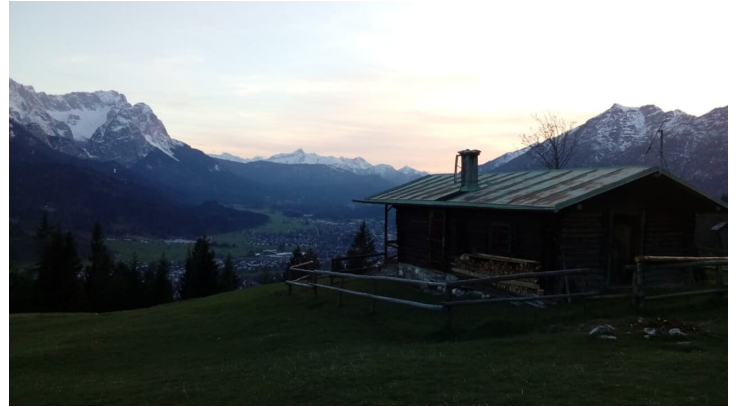
Sonnenuntergang bei der Eckenhütte