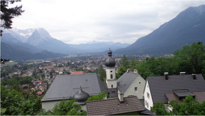
St. Anton am Wank