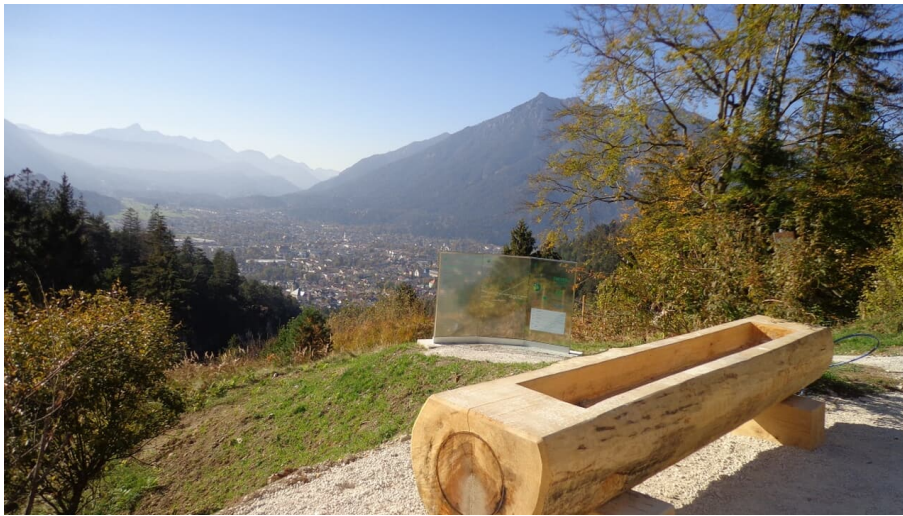
Blick von der Tannenhütte