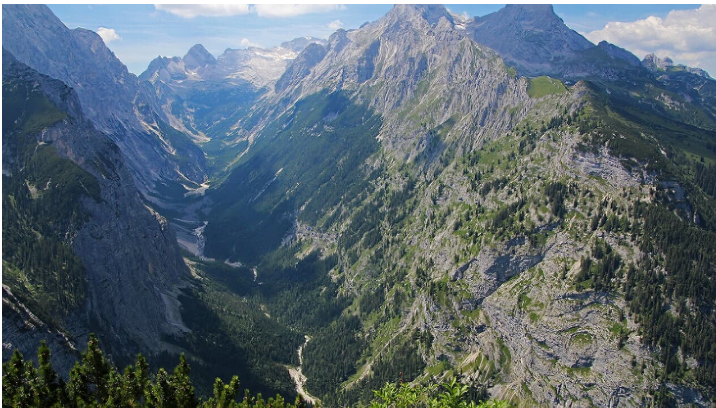
Blick ins Reintal