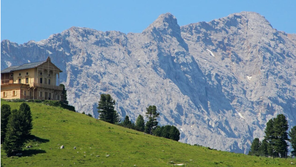
Schachen Schloss - © GaPa Tourismus GmbH/Martin Gulbe, GaPa Tourismus GmbH