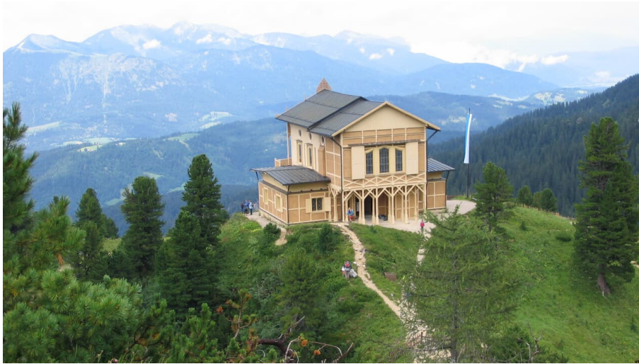
GaPa Tourismus GmbH