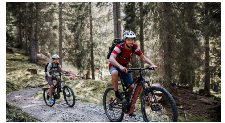
Mountainbiketour in der Zugspitz Arena Bayern-Tirol