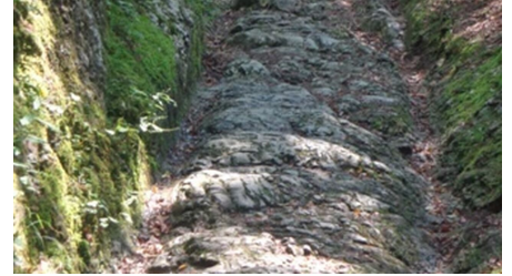
Römerweg in Klais