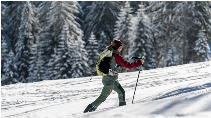
Skitour Naturpark