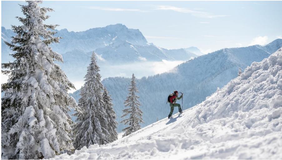
Skitour Laber mit Zugspitzblick