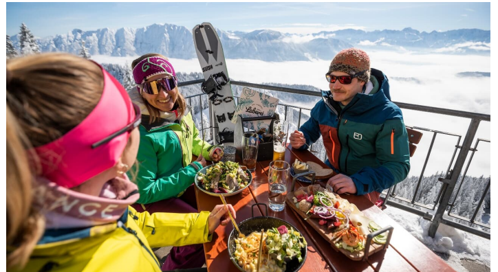
Mittagspause Laber Bergstation mit Zugspitzblick