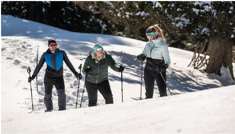
Schneeschuwwandern Naturpark Ammergau Alpen