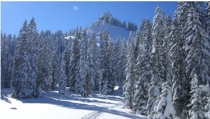
Schneeschuhwanderung Laber - Ettaler Manndl