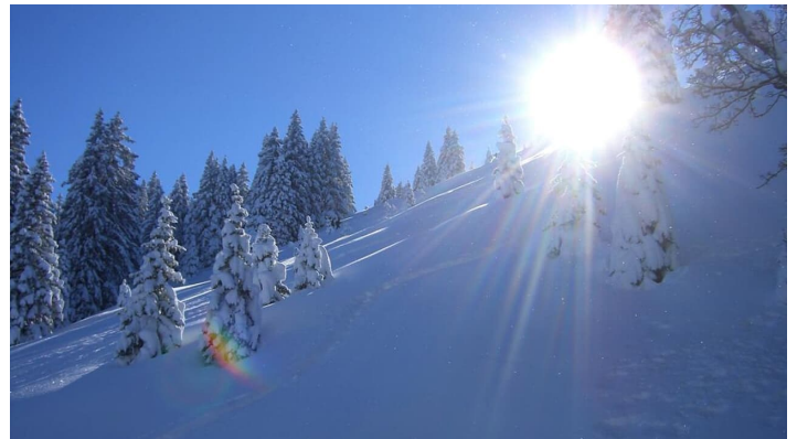
Schneeschuhwanderung Laber - Wintersonne und verschneiter Bergwald am Ettaler Manndl - © Thorsten Unseld, Sebastian Heckelmiller