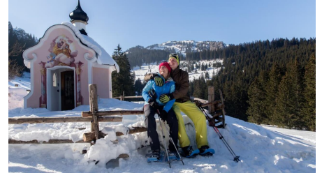
Schneeschuhwanderung Pürschlinghaus - an der Josephskapelle - © Thorsten Unsel, Best of Winter CC Thomas Bichler