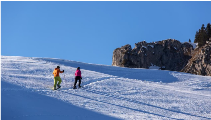
Schneeschuhwanderung Pürschlinghaus