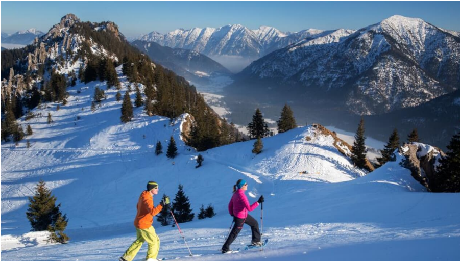
Schneeschuhwanderung Pürschlinghaus