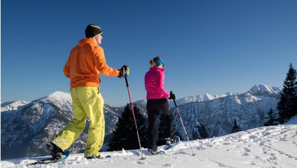
Schneeschuhwanderung Pürschlinghaus