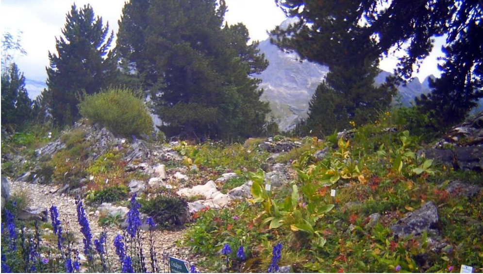
Alpengarten am Schachen