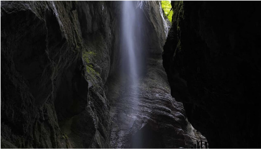
Partnachklamm - © GaPa Tourismus Online, GaPa Tourismus GmbH