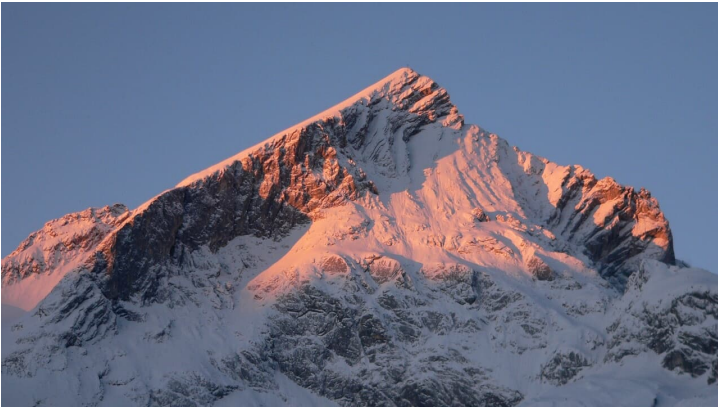
Alpspitz im Winter