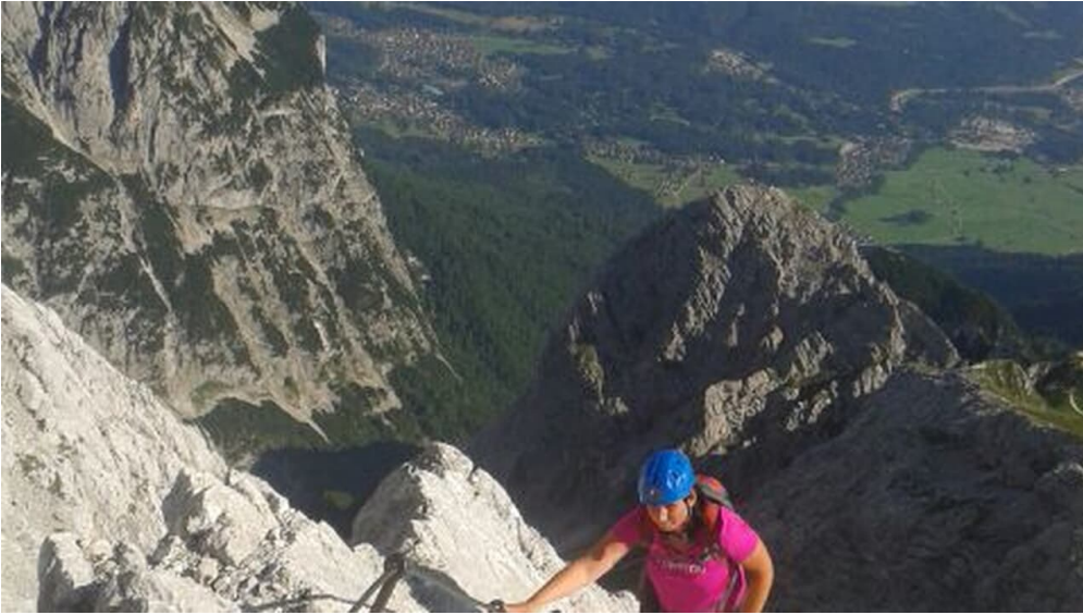
Feratta Klettersteig