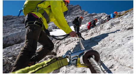
Klettersteig zur Alpspitz