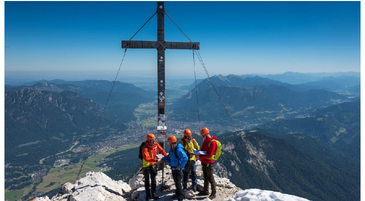
Alpspitz Gipfel