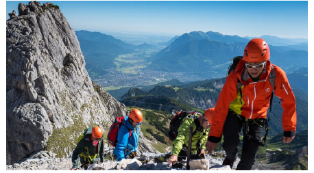
Alpspitz Ferrata