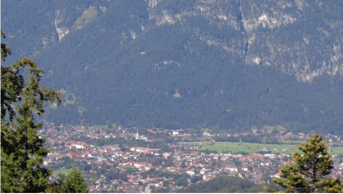
Blick auf den Kramer