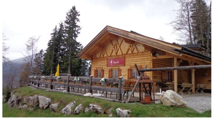
Gamsalm in Ehrwald