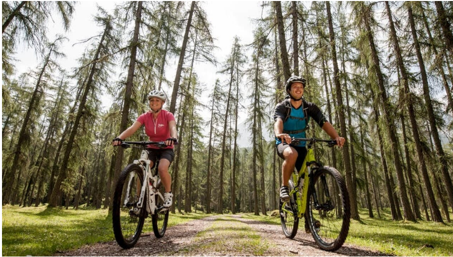
Mountainbiketour in der Zugspitz Arena Bayern-Tirol (Lärchenwald Ehrwald)