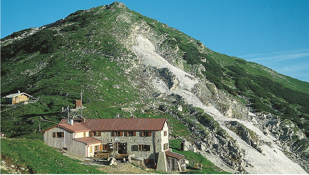
Weilheimer Hütte