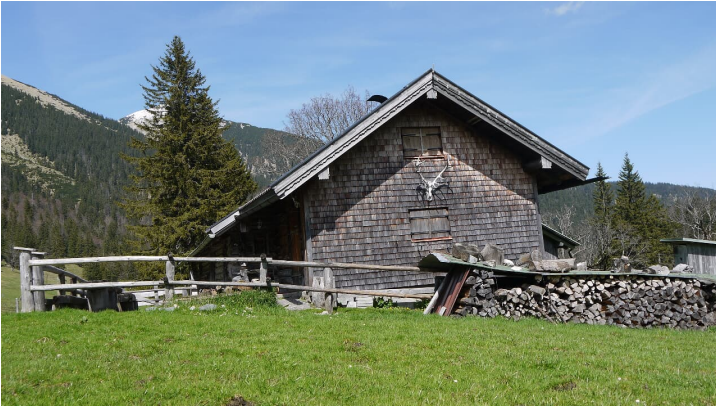
Farchanter Alm