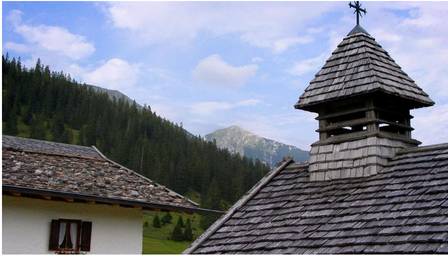
Die Esterbergalm mit Kapelle, im Hintergrund der Krottenkopf.