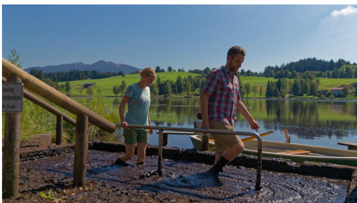
Moortretbecken - Moorlehrpfad Bad Bayersoien