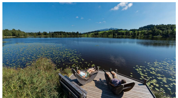
Moorlehrpfad Bad Bayersoien