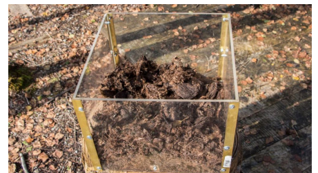
Moorlehrpfad Bad Bayersoien