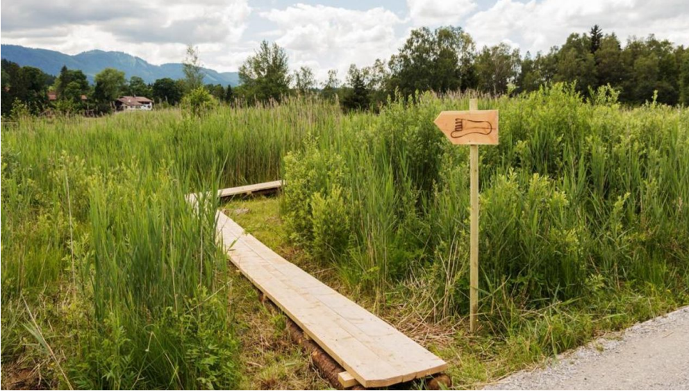
Themenweg - Barfußpfad - Soier See