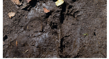
Barfußlehrpfad Bad Bayersoien