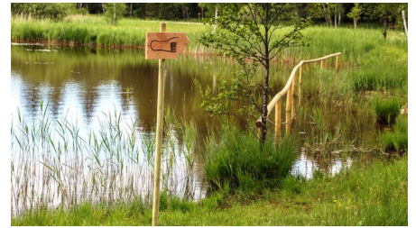
Themenweg - Barfußpfad - Soier See - © Thorsten Unseld, Naturpark Ammergauer Alpen