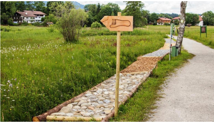
Themenweg - Barfußpfad - Soier See - © Thorsten Unseld, Naturpark Ammergauer Alpen