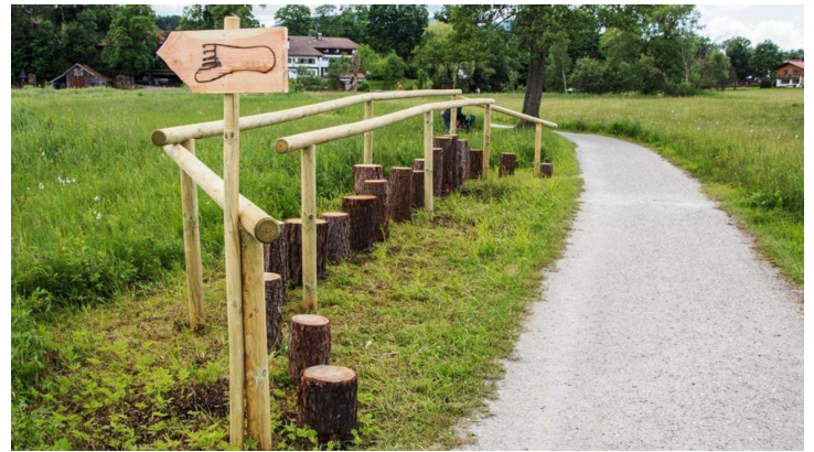
Themenweg - Barfußpfad - Soier See