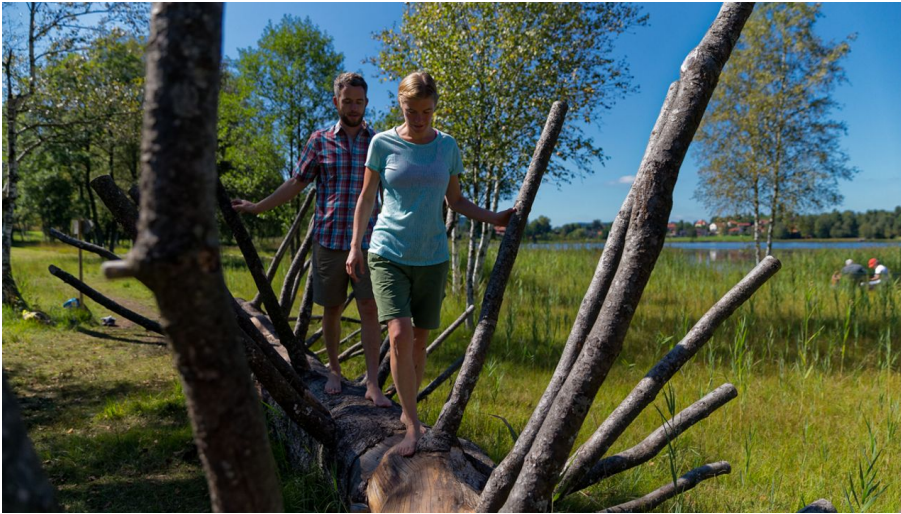
Barfußlehrpfad Bad Bayersoien