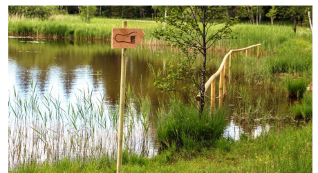
Themenweg - Barfußpfad - Soier See