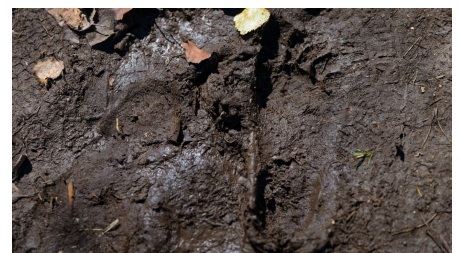
Barfußlehrpfad Bad Bayersoien