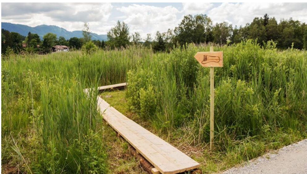
Themenweg - Barfußpfad - Soier See

Prospektmaterial ansehen und/oder bestellen