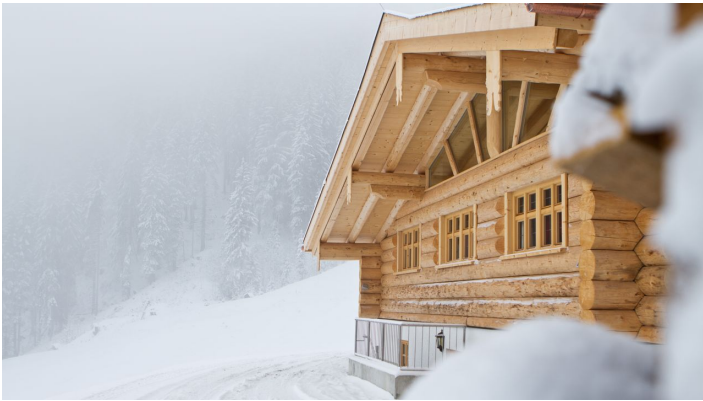
Skitour Kolbensattel - © Thorsten Unseld, AktivArena am Kolben CC Matthias Fend

Prospektmaterial ansehen und/oder bestellen