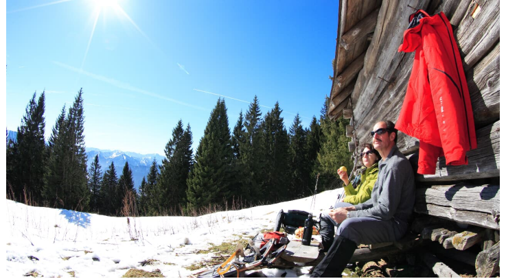
Schneeschuhwanderung von Bad Kohlgrub nach Oberammergau - Brotzeit in der Wintersonne