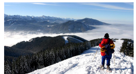
Schneeschuhwanderung von Bad Kohlgrub nach Oberammergau - am Vorderen Hörnle