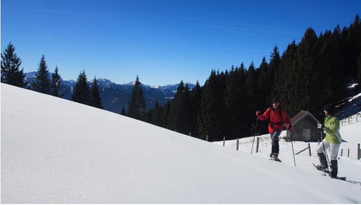
Schneeschuhwanderung von Bad Kohlgrub nach Oberammergau - am Aufacker