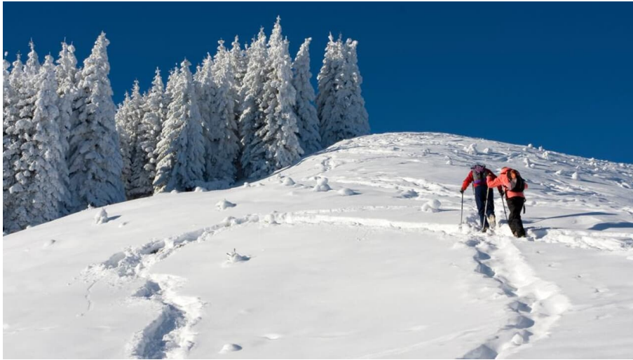
Schneeschuhwanderung von Bad Kohlgrub nach Oberammergau - an der Hörnlealm