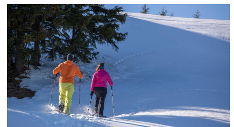
Schneeschuhwanderung von Bad Kohlgrub nach Oberammergau