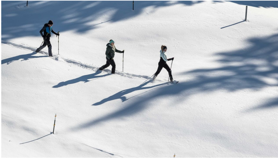
Schneeschuhwandern Naturpark Ammergauer Alpen