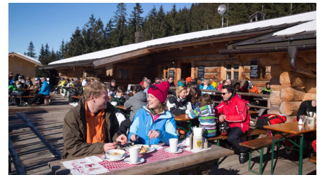
Schneeschuhwanderung von Unterammergau nach Oberammergau - an der Kolbensattelhütte - © Thorsten Unsel, Best of Winter CC Thomas Bichler