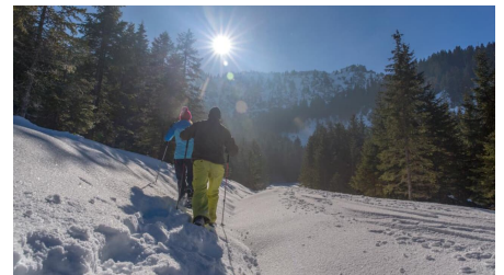
Schneeschuhwanderung von Unterammergau nach Oberammergau