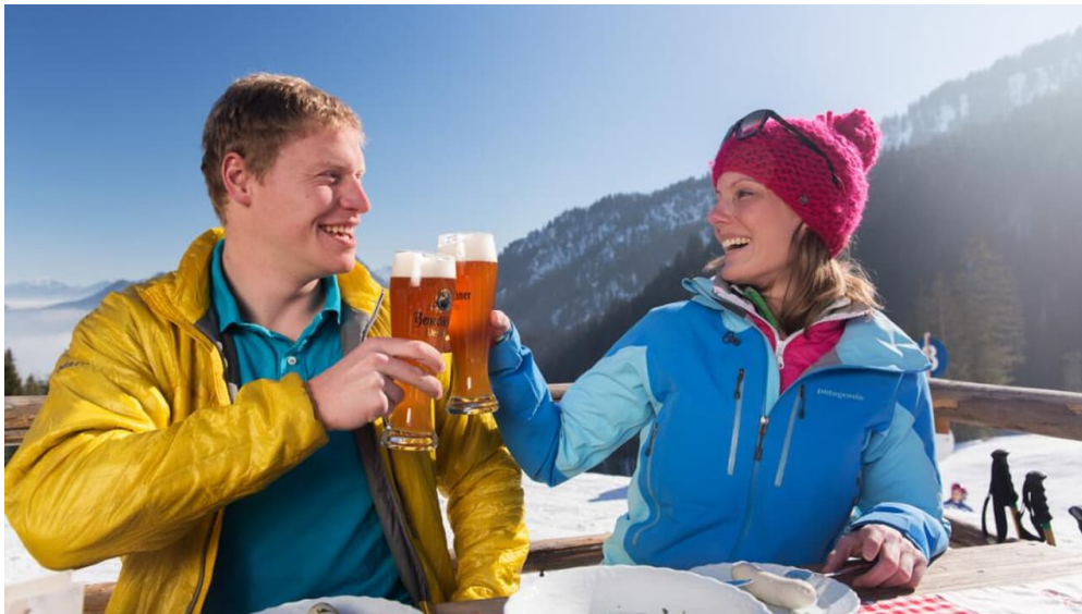
Schneeschuhwanderung von Unterammergau nach Oberammergau - Weißwurst und Bier auf der Kolbensattelhütte - © Thorsten Unsel, Best of Winter CC Thomas Bichler

Prospektmaterial ansehen und/oder bestellen