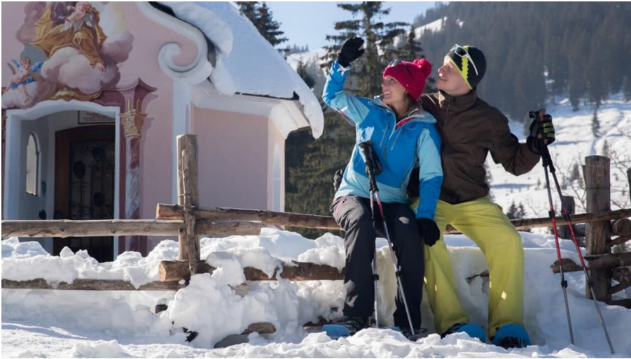
Schneeschuhwanderung von Unterammergau nach Oberammergau - an der Josepshkapelle