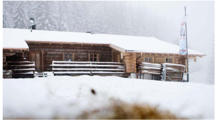
Schneeschuhwanderung von Unterammergau nach Oberammergau - an der Kolbensattelhuette