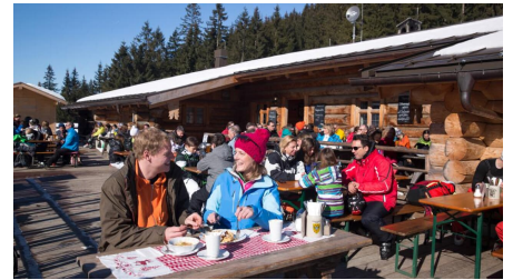
Schneeschuhwanderung von Unterammergau nach Oberammergau - an der Kolbensattelhütte - © Thorsten Unsel, Best of Winter CC Thomas Bichler