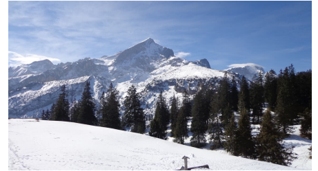
Blick auf die Alpspitze