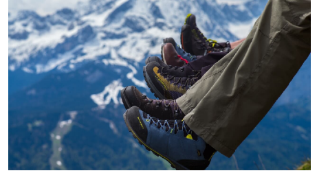
Blick vom Wank, auf die Skiabfahrten in Garmisch-Partenkirchen