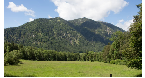
Walderlebnispfad Ettal, Ochsenstz und Ziegelspitz