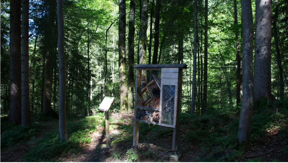
Walderlebnispfad Ettal, Insektenhotel