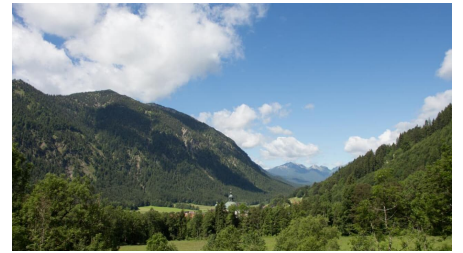
Walderlebnispfad Ettal, Blick ins Graswangtal