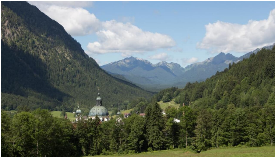
Walderlebnispfad Ettal, Scheinberg und Große Klammspitze