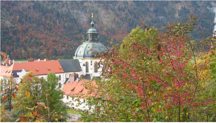
Themenweg - Walderlebnispfad, Ettal - Blick auf das Kloster