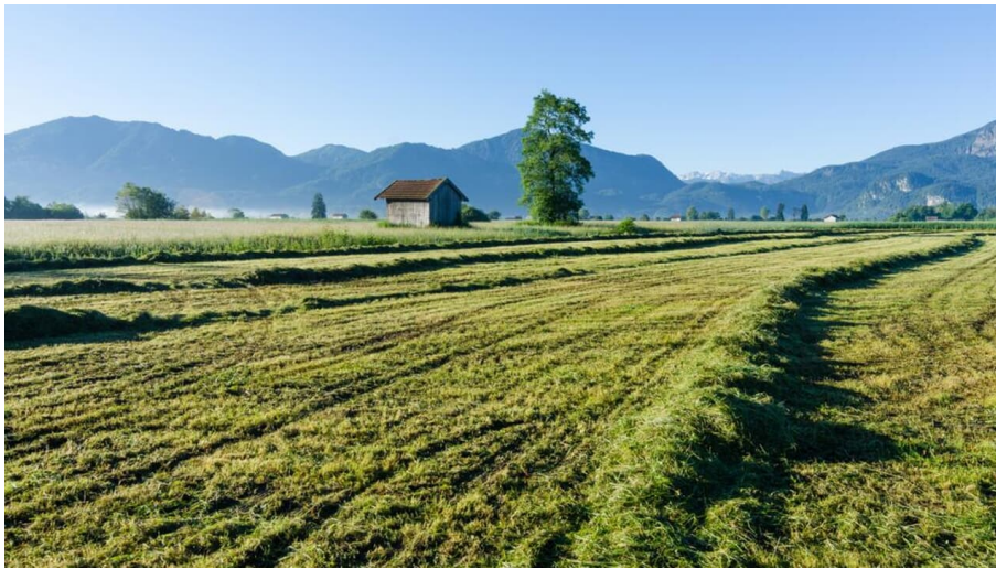
Wanderung - Loisach-Rundweg - landschaftliche Idylle