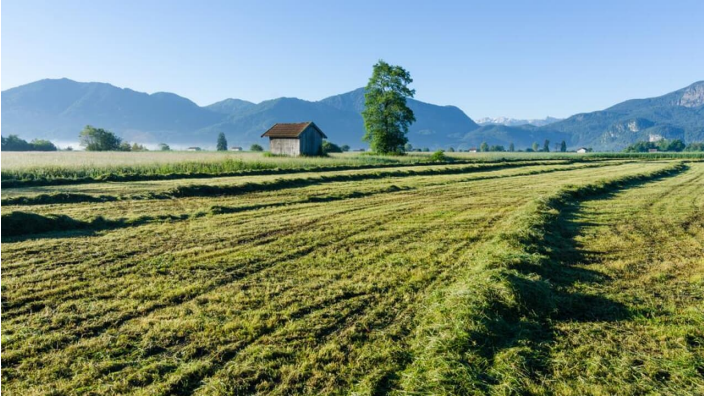
Wanderung - Loisach-Rundweg - landschaftliche Idylle - © Das Blaue Land / Simon Bauer