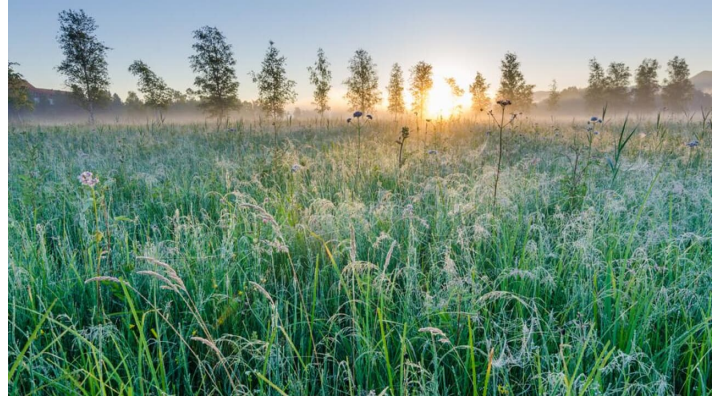
Wanderung - Loisach-Rundweg - Wiesen bei Großweil - © Das Blaue Land / Simon Bauer