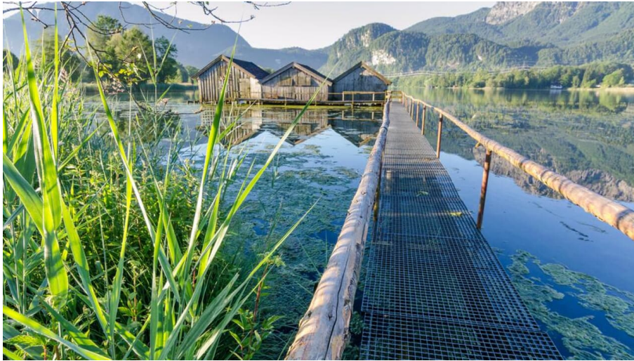
Wanderung - Loisach-Rundweg - Bootshäuser am Kochelsee - © Das Blaue Land / Simon Bauer