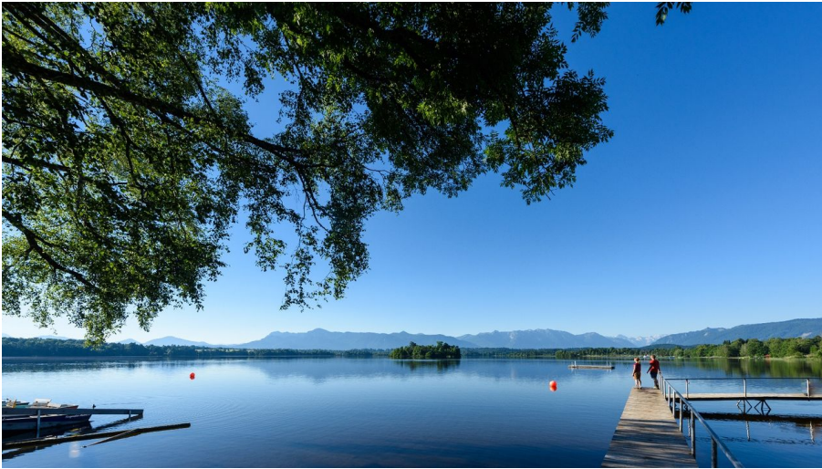
Wandern um den Staffelsee