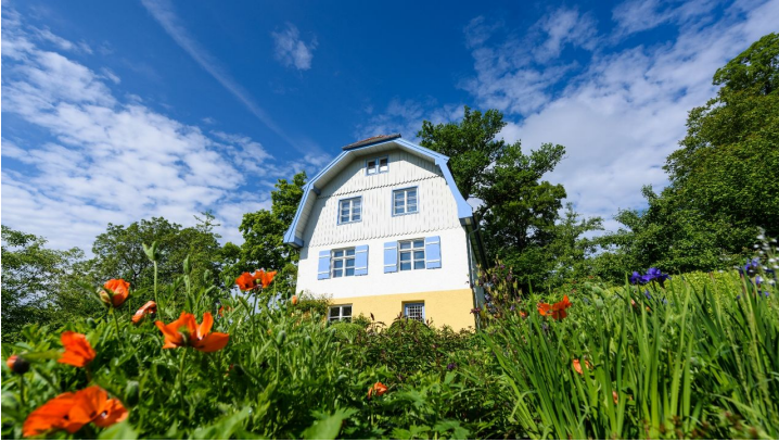
Das Mürter Haus in Murnau