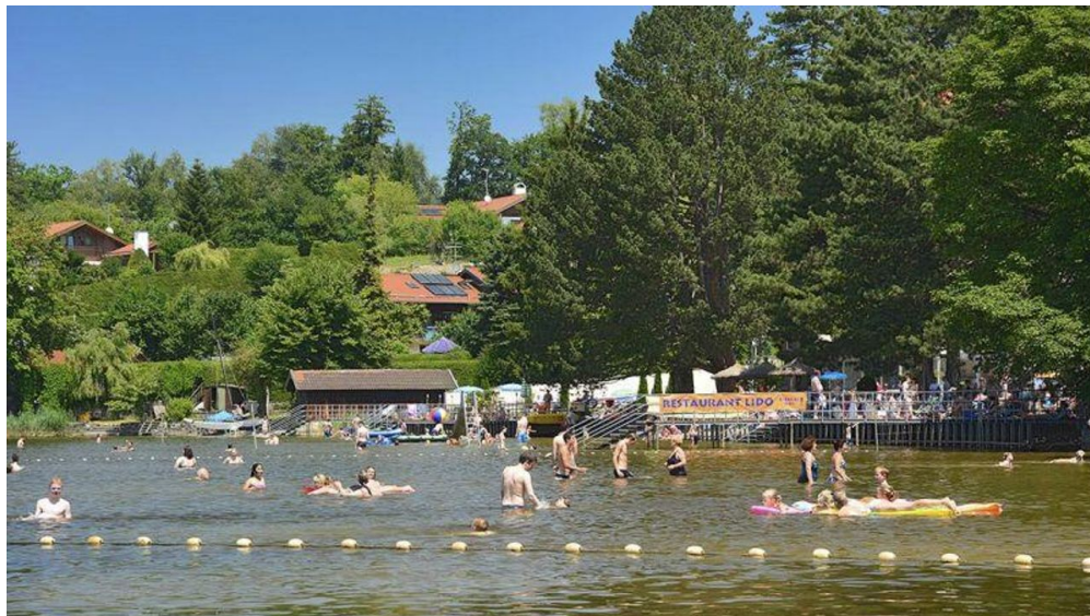
Wanderung - Drachenstich-Rundweg - Strandbad am Staffelsee