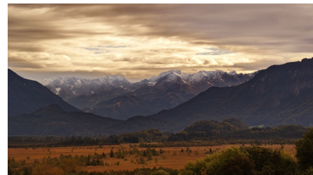
Wanderung - Drachenstich-Rundweg - Föhnstimmung im Murnauer Moos