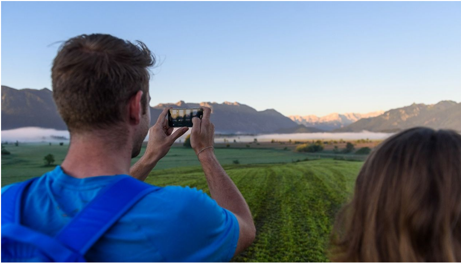
Wanderung - Drachenstich-Rundweg - Blick auf das Murnauer Moos