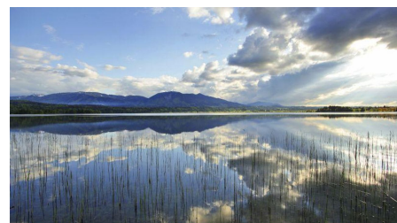
Wanderung - Drachenstich-Rundweg - Spiegelungen im Staffelsee