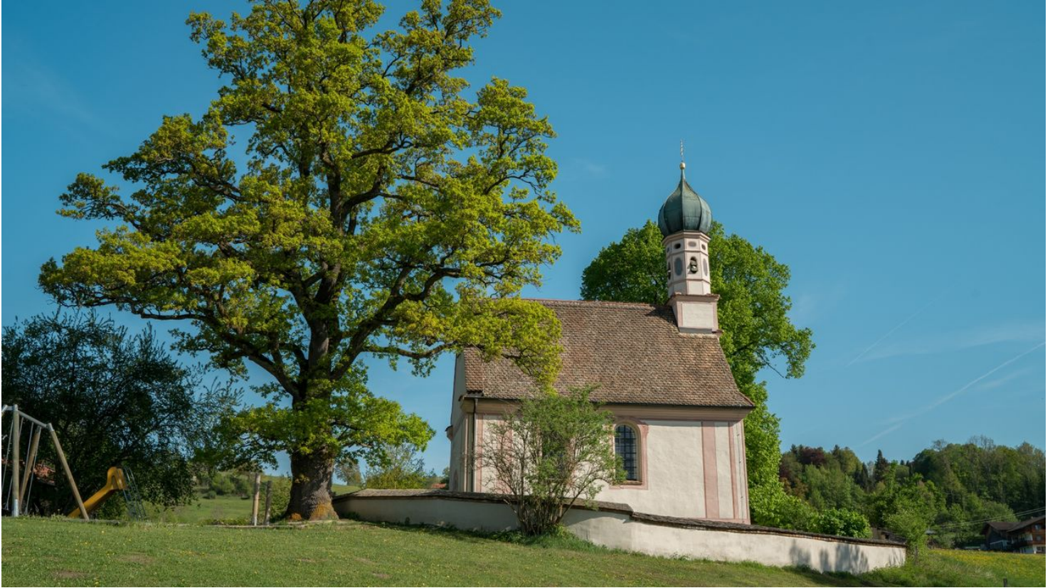
Das Ramsachkircherl am Murnauer Moos