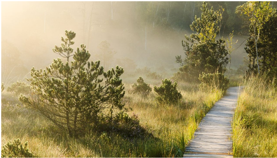
Bohlenweg im Murnauer Moos