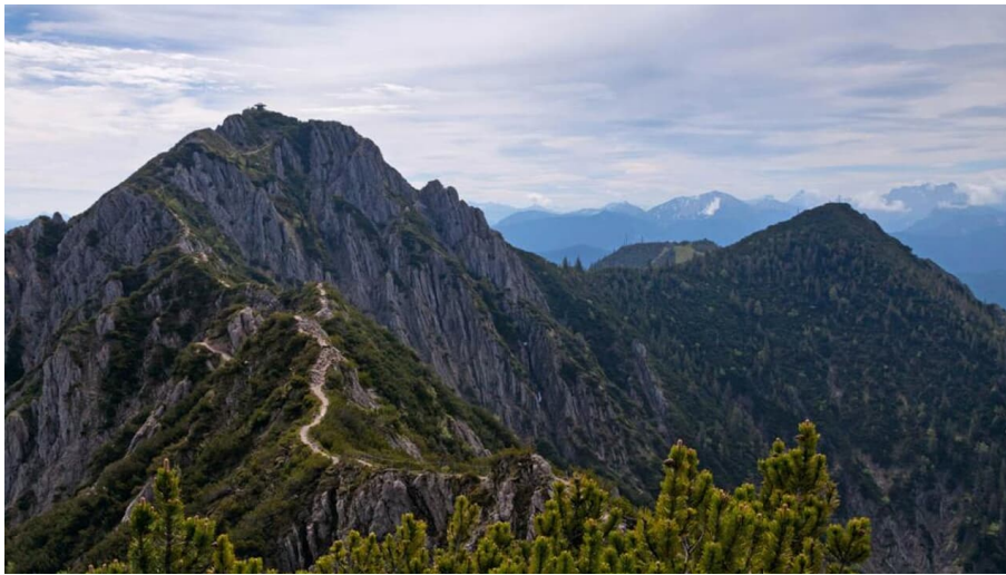
Bergtour - Heimgarten über die Käseralm - Blick vom Heimgarten auf den Herzogstand