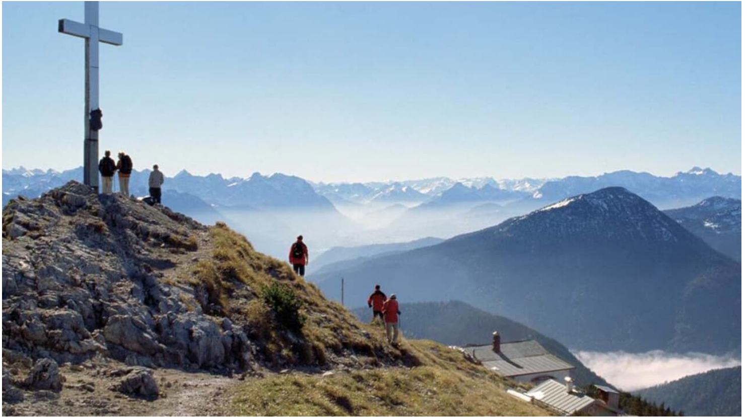
Bergtour Heimgarten über die Kaseralm - Ausblick vom Heimgarten