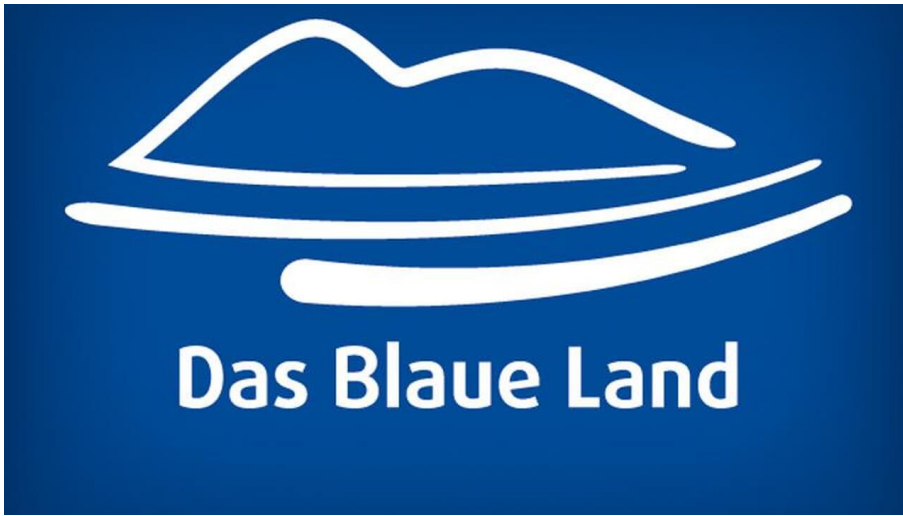
Das Blaue Land